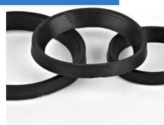
O - RING