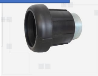
TERMINAL HE HEMBRA