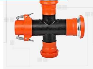
CRUZ CON ENGANCHE