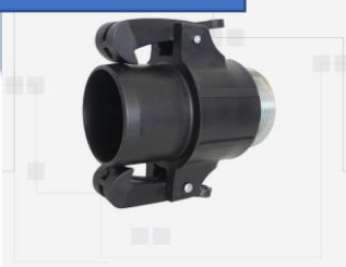
TERMINAL HE MACHO