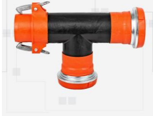
TEE CON ENGANCHE