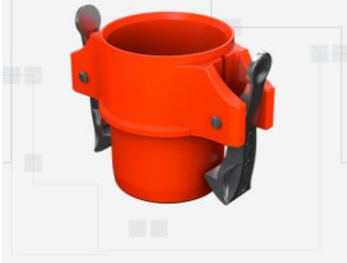
TAPÓN CIEGO MACHO