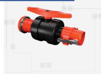
VÁLVULA DE BOLA